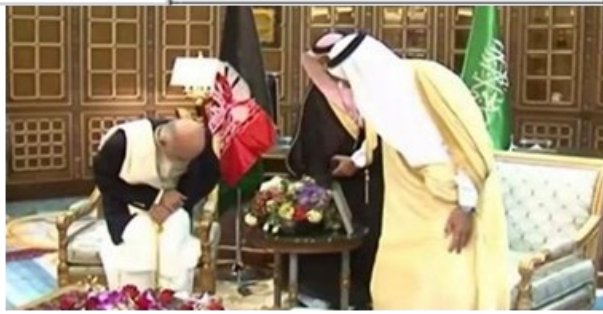
آدم از بی بصری، بنسنگی آدم کرد گوهری داشت ولی نسنر قباد و جم کرد یعنی از خوی غلامی زسگان خوار تراست من ندیدم که سگی پیش سگی سرخم کرد

امید را برای دوستان تان اشتراک کنید. مطمئن باشید از شما ممنون می شوند.