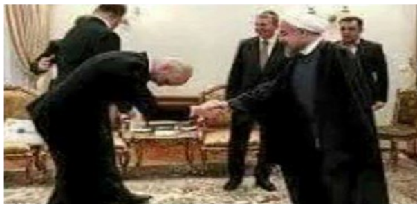
از غلامی دل ببید در بدن از غلامی روح گردد بار تن ایبات از علامه اقبال لاهوری