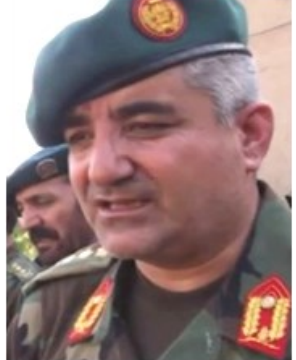
جنرال قدمشاه شهیم رئیس ستاد ارتش

غیر نظامیان، به نیروهای امنیتی افغان و نیروهای بین المللی حمله میکنند. انتظار میرود با رفع محدودیتها، نظامیان در میدانهای جنگ دست بالایی پیدا کنند. نظامیان افغان با رها اعتراض کرده بودند که شکست دادن شورشیان با آتش سلاح سبک ممکن نیست و باید برای پیروزی در میدانهای جنگ، از آتش توپخانه استفاده شود.