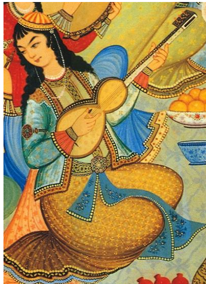
زنی در حال نواختن تار

دلی دارم چو مرغ پا شکسته چو کشتی بر لب دریا نشسته همه گویند طاهر تار بنواز صدا چون می‌دهد تار شکسته