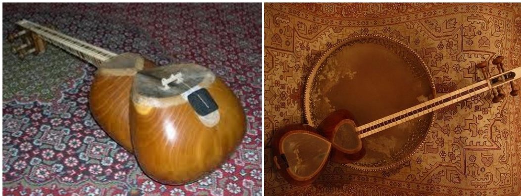
تار (چهارتار و شش‌تار هم نامیده شده است)